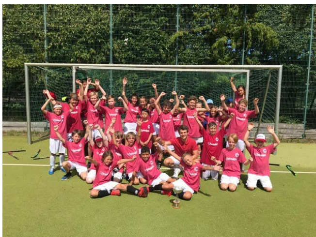
Deutscher U21 Europameister als Gasttrainer beim SCC Sommerhockeycamp

Für die Kids startete der Tag um 9:00 Uhr beim Frühstück. Es gab belegte Brötchen, Müsli und viel Obst und Gemüse. Um 10:00 Uhr startete die erste Trainingseinheit, zu der die Gruppe nach der Erwärmung meistens geteilt wurde, um alle Kinder besser individuell trainieren zu können und an unterschiedlichen Stationen vielseitige Übungen anzubieten. Nachmittags gab es an einigen Tagen noch Konditions-, Kraft- und Koordinationstraining und vor allem meistens den spielerischen Teil des Tages. Die Teilnehmer konnten sich im Zielschießen oder in Kleingruppen in verschiedenen spielerischen Übungen versuchen. Täglich gab es ein großes Abschlussspiel, bei dem die Mannschaften wild gemischt wurden. Freitags sorgte nach den Trainingseinheiten eine Wasserrutsche und ein Sprenger bei den Kleinsten für jede Menge Spaß und Abkühlung.