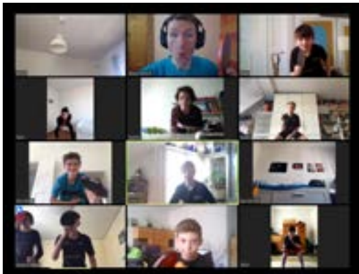
Unser Online-Training „Sportlich am Ball bleiben“ ...

Der kleine weiße Plastikball ist verstummt, die Rückrunde vorzeitig beendet. Seit Freitag, dem 13. März gibt es keine Topspinduelle mehr. Wir bleiben jedoch tapfer und warten geduldig und mit Vorfreude auf den Neustart. Solange motivieren wir unsere Jüngsten mit Online-Training und den „Botschaften von Zuhause“.