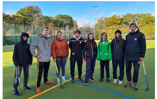
Das Trainerteam unseres Hockey-Camps

Nach langer Pause durch Corona und die Platzsperrung am Kühlen Weg startet ab dem 29.10.21 endlich wieder das Elternhockey freitags von 20:00 Uhr bis 21:30 Uhr in der Halle der Waldoerschule. Auch Eltern anderer Sportarten sind herzlich willkommen, sich einmal auszuprobieren.