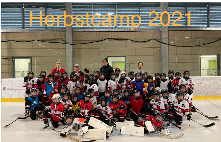
Spaß beim Eishockey-Camp: der jüngere Teil der Kinder U9-U12

Unser Herbstcamp war ein voller Erfolg. Den Kindern war ihre Freude anzumerken, endlich wieder viel auf dem Eis trainieren zu dürfen und sich auf die kommenden Spiele vorbereiten zu können.