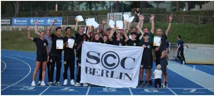
Team U 16