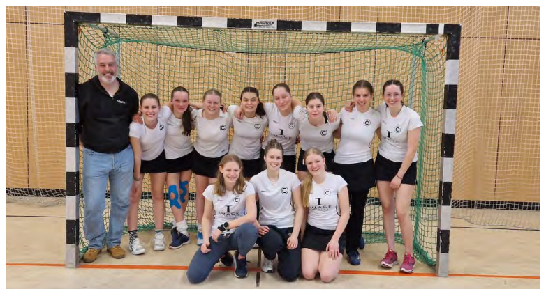
Die weibliche Jugend B

Im Jugendbereich beendete die weibliche Jugend A die Saison auf dem ersten Platz der Liga. Die weibliche Jugend B wurde dritter, die männliche U18 hat ebenfalls den Ligapokal geholt, die männliche U 14 belegte den zweiten Platz.